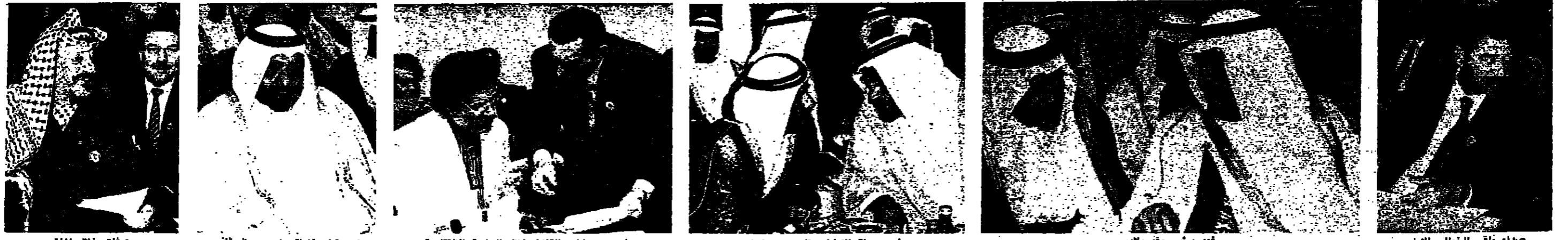
صدام يلقي الخطاب الاول / قهد يريش وقد بلاده / رئيس دولة الامارات زايد بن سلطان / حوار بين مبارك والقذافي خلال الجلسة الافتتاحية / امير قطر خليفة بن حمد آل ثاني / عرفات خلال المؤتمر

وقالت مصادر المؤتمر ان موقف القليبي لم يحظ حتى الآن بأي تفسير مقنع رغم التبريرات التي اعطاها ، والتي ترتكز على صعوبة ارسال موفد الى بيروت لاسباب أمنية ، وربما نسي القليبي كيف ان المندوب المفوض للجامعة العربية الاخصر اليراميسي ، كان يزور لبنان في ظروف أكثر خطورة وقسوة مما هي اليوم وكيف كان يتكلم من مقابلة جميع المسؤولين فيه . ويتحدث المصادر عن خلفيات غير واضحة لوقف القليبي ، ربما كان بينها انه لم يعد يعتبر لبنان دولة عربية وعضوا في الجامعة . وفي الجلسة الافتتاحية ، لم يرد لبنان الا في تقرير القليبي نفسه ، وفي اشارة ملطفة ضمنها الرئيس المصري خطاب . واعتبرت مؤشرا الى عدم تسيان القضية اللبنانية عن رغم غياب ممثلها عن القمة . وقال القليبي في تقريره ان المساعي تواصلت طوال هذا العام منذ قمة الدار (البقية على الصفحة ٩)